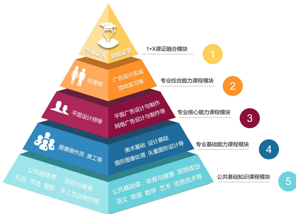
专业课程结构图示