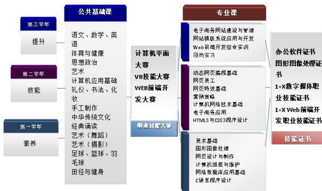
“课+证+赛”融通的递进式课程体系示意图

以校内实训室、校内实习基地和校外实习基地搭建的所有教学活动平台，培养学生的职业基本能力、职业核心能力和职业综合能力，实现学生在校学习理论知识的同时，通过参加技能大赛实现与企业需求零距离融合，再通过考取相关技能证书，获得企业的技能认可，从而培养学生走出校门即可获取进入企业任职的资格，使学生所学知识不与企业需求脱节，毕业即可上岗。