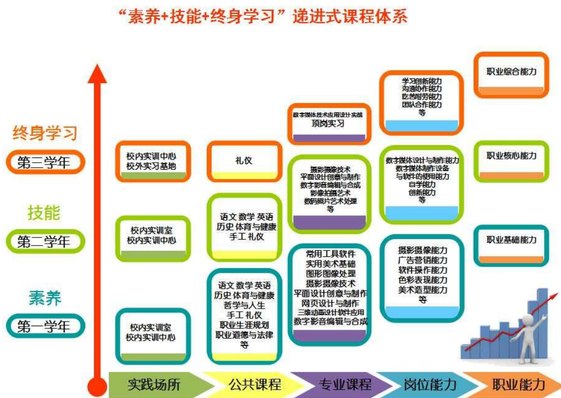
“素养、技能、终身学习”的递进式课程体系示意图

小组，在对行业需求、职业资格认证标准、岗位能力分析的基础上，构建数字媒体及相关行业岗位群的知识体系，进而得出本专业的课程。课程一方面按照由基础知识、基础能力、核心能力、综合能力的层层递进关系设置；另一方面按照“学生-学徒-职员”由简单到复杂，由低级到高级的身份转换，由单一到综合的知识体系层层深入，构建出“素养、技能、终身学习”的递进式课程体系。课程体系如图所示：