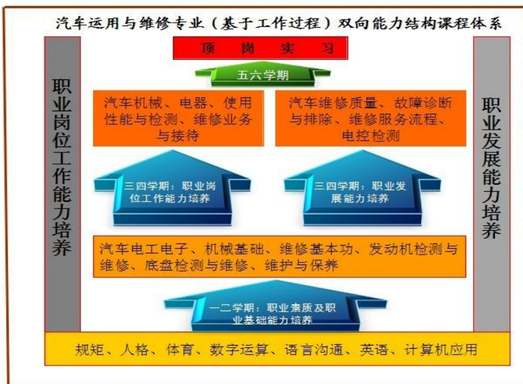
专业课程体系结构图