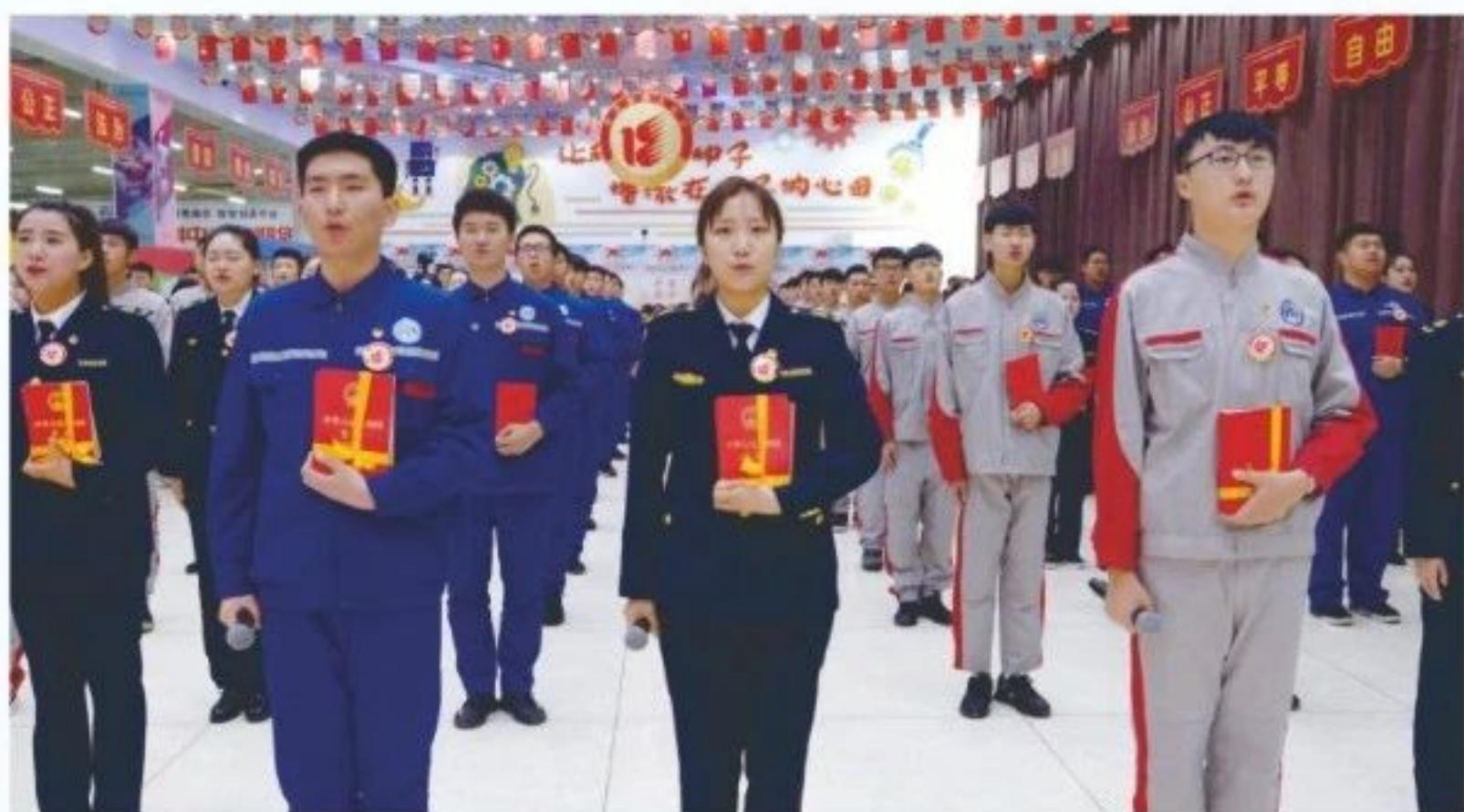
注：升学实验班具体招生计划及范围以上级部门审批为准。

● 优势三： 告别应试教育繁重的学业负担，提前确定升学目标，无需额外费用，避免不必要的补课花销，精准确定学习范围，让升学过程简单高效。